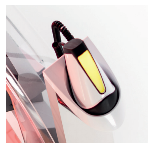
GIALLO: Pronto per la misurazione

Rimettere il sensore nella sua postazione dopo aver effettuato le misurazioni. L'apparecchio si avvia automaticamente o premendo il pulsante di avvio sul display interno.