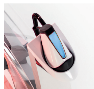
BLU: Sensore pulito