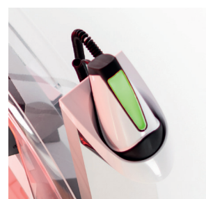
VERDE: Misurazione riuscita