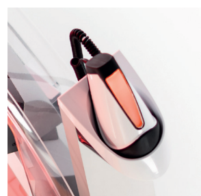
ROSSO: Misurazione non possibile